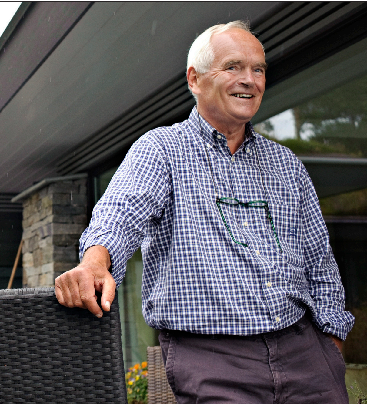
ikke morselskapet Frank Mohn AS lenger noen eksterne styrerepresentanter.