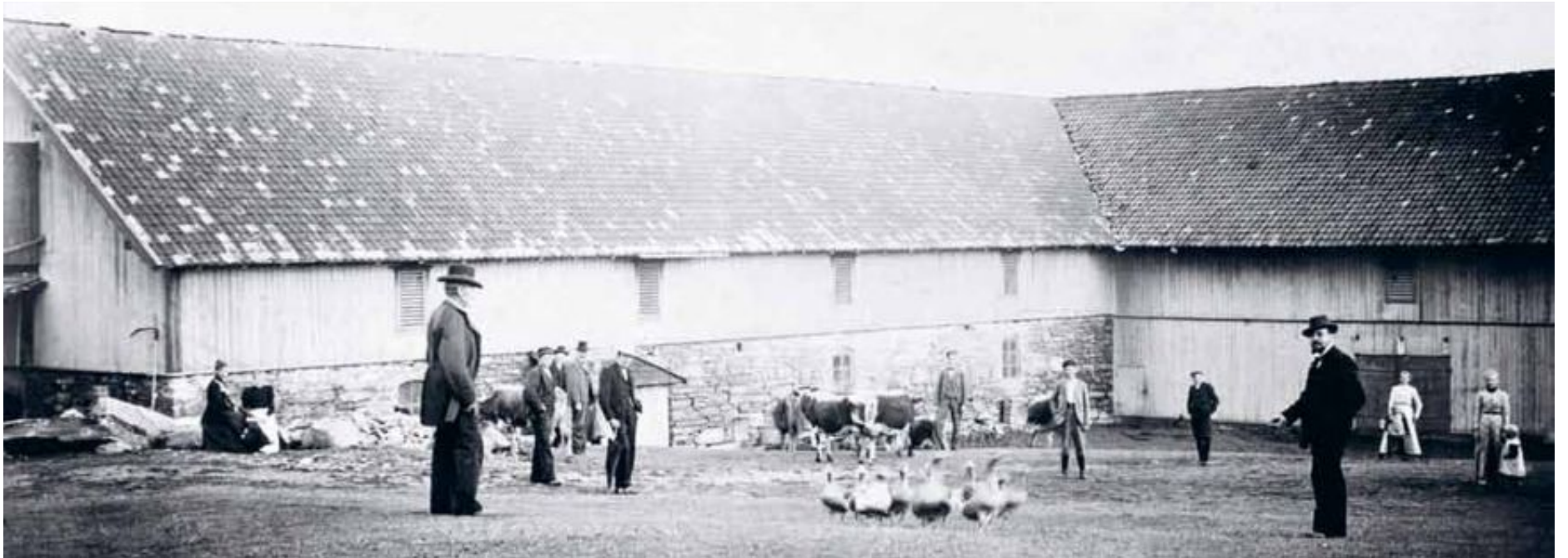
Investeringsvilje: Driftsbygningene var det mest markante uttrykket for investeringsviljen i landbruket. Her fra Wetten gård i Furnes i 1890-årene.

1958: Samtrygd inngår samarbeidsavtale med Norges Bondelag.