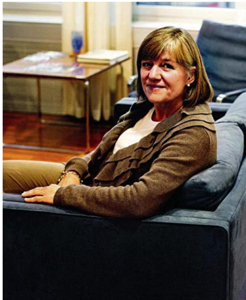
LØNNSOMME? En ny studie tyder på at kjønnskvolteringen til ASA-styre har vært negativt som alle tilhører den norske styreadelen. Disse fire har ingenting med studien å gjøre.