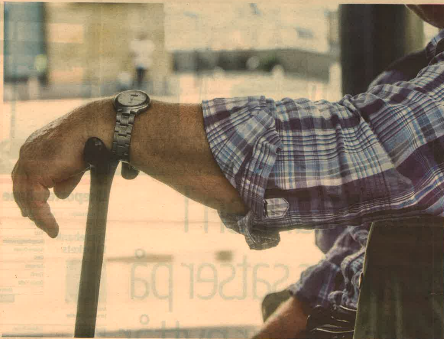
Pensjonskassen omfattet statens tjenstemenn, landets lærere og etter hvert andre grupper, skriver forfatteren.

Våren 1917 vaklet likevel hele pensjonsordningen en periode på den parlamentariske avgrunnens rand på grunn av striden om mannlige